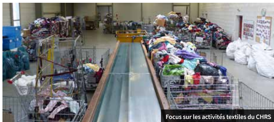
Focus sur les activités textiles du CHRS

Pour en apprendre plus sur Tremplin : www.tremplin01.org