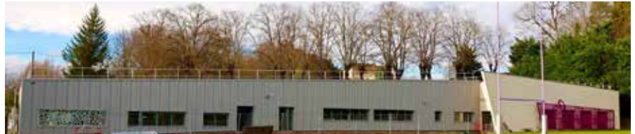
Le nouveau bâtiment du centre d'entraînement est construit dans le prolongement de la salle de sport et sera accessible, pour les joueurs comme pour le public, par l'allée de Challes.

mètres carrés accueillera surtout les équipements propres à un centre de formation avec salles de cours modulables et équipement vidéo pour analyser sur grands écrans les matchs des violets et ceux de leurs adversaires. Le staff sportif disposera d'un espace capable d'accueillir six de postes de travail. Une autre partie de ce nouveau bâtiment accueillera une salle de réunion et des espaces dédiés aux médecins et aux kinés. Les équipes administratives et commerciales de l'USBPA, ballottées jusque-là de cellules Algéco assemblées en occupation précaire de l'ancienne maison du gardien du stade, s'installeront enfin dans des murs en dur, symboles de stabilité et de pérennité. « Un équipement simple mais pratique qui répond à nos besoins », explique Jacques Page, le coprésident en charge du sportif et des infrastructures de l'USBPA et superviseur des travaux en professionnel du BTP qu'il est. « Cet équipement nous installe dans de bonnes conditions de travail et nous permet de nous concentrer sur le sportif. De plus, lorsqu'on recrute des joueurs, leur montrer des infrastructures modernes et adaptées est un atout. Nous sommes en concurrence avec les autres équipes du circuit professionnel et un joueur de bon niveau fait aussi son choix de club en fonction des équipements que celui-ci peut mettre à sa disposition », confirme Yoann Boulanger, l'entraîneur référent de l'USBPA.